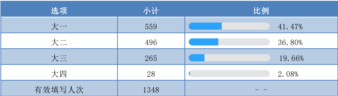
附表 2-1 参与调查的学生结构情况

大学生学习满意度与专业选择、课程设置、师资因素、软硬件设施、学生服务与管理等方面密切相关。因而在研究设计中以此为依据，问卷共设计相关测量